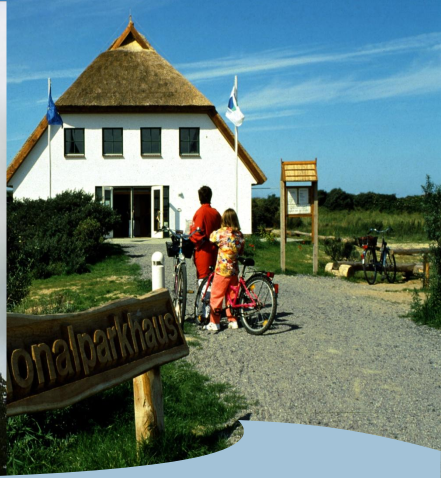
Nationalpark Vorpommersche Boddenlandschaft Besuchereinrichtungen in Barhöft und Vitte/Hiddensee