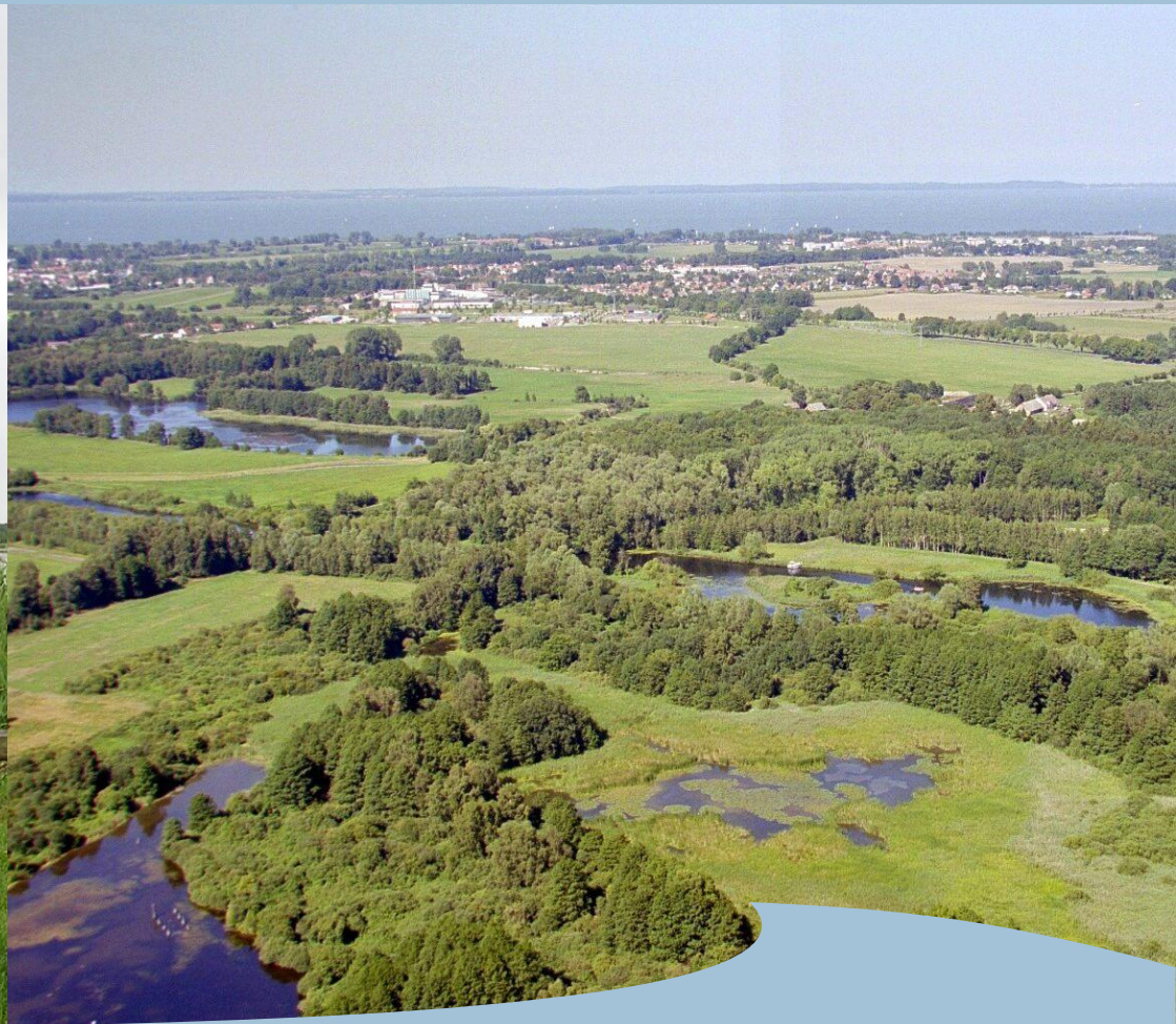
Naturpark Am Stettiner Haff Haff und Uecker