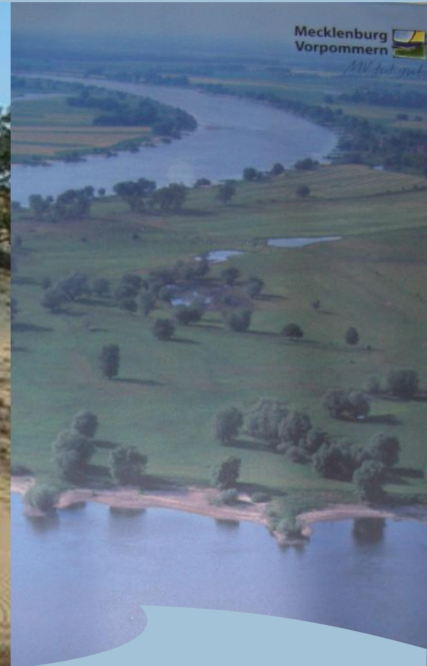
Biosphärenreservat Flusslandschaft Elbe Elbtaldünen bei Klein Schmölen