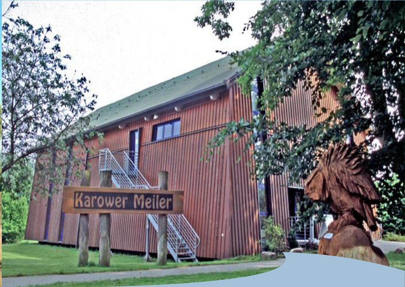
Naturpark Nossentiner Schwinzer Heide Wacholderwald und Infozentrum Karower Meiler