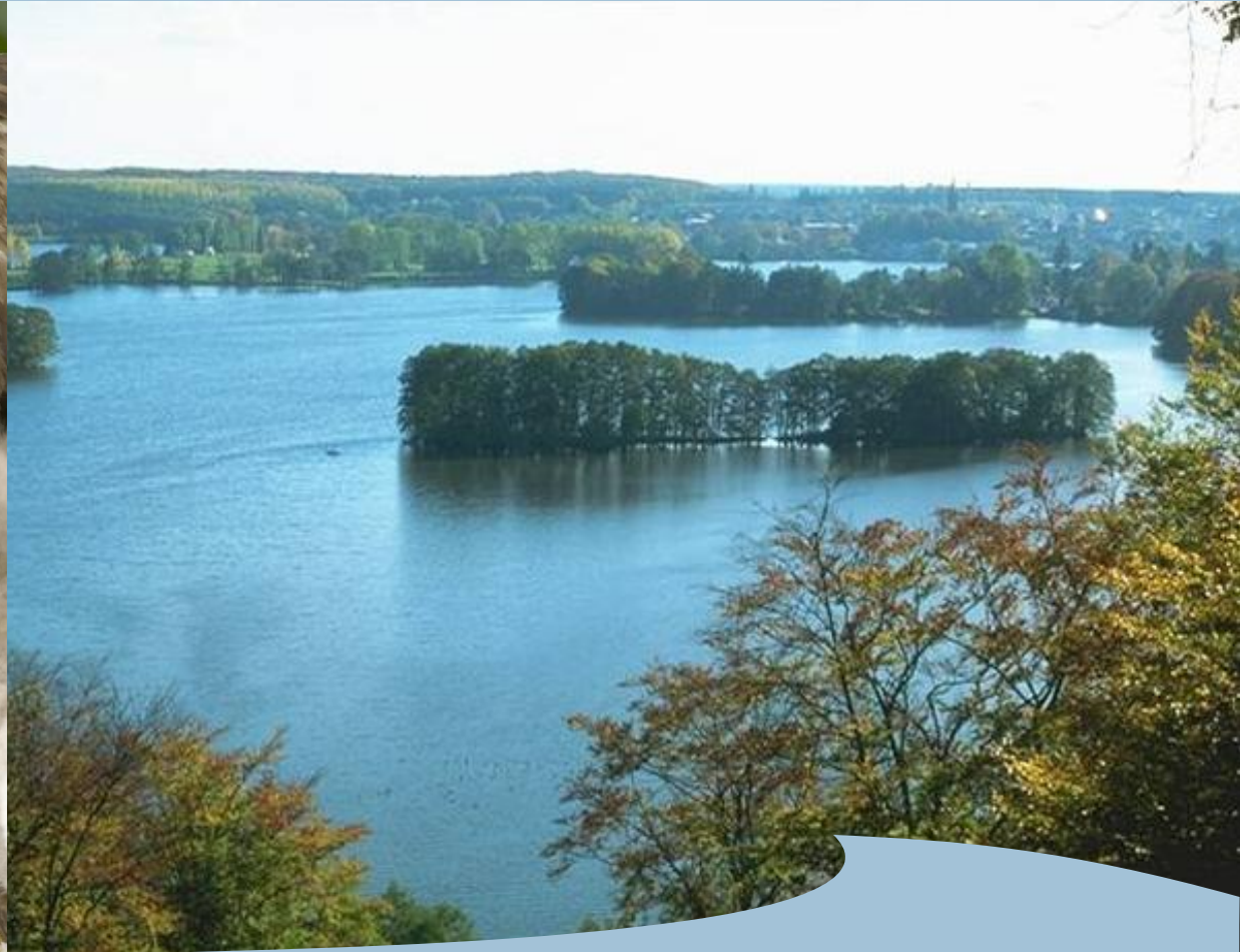
Naturpark Feldberger Seenlandschaft Schreiadler und Blick auf Feldberg