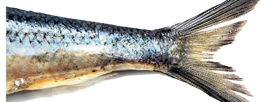
Schnell weg: Der Hering gehört zu den wichtigsten Beutetieren des Schweinswals.

Das Gehirn des Schweinswals muss Höchstleistungen vollbringen, um die einpassierenden Signale zu erkennen und zu verarbeiten – zumal unter den in der Ostsee herrschenden Bedingungen. Andere Wale jagen in reißerischeren Gewässern, in den Tiefen der Hochsee etwa. Dort lenkt kaum etwas von der Jagd ab. Ganz anders in den Flachwasserzonen der