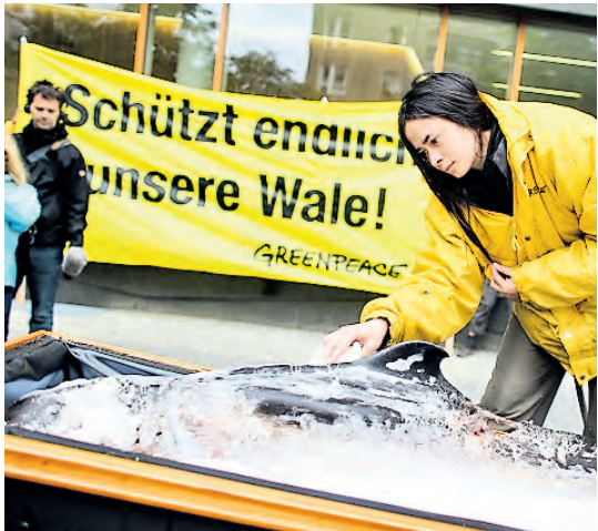
Aufklärungskampagne: Auch Greenpeace setzt sich für den heimischen Wal ein.

» Im Detail funktioniert er so. Der große, in der westlichen Ostsee beheimatete Schweinswal-Trupp reist aus der dänischen Belsee, dem Kattegat, zirkte ab Juni in die Pommerse Bucht. Dort blieben die Tiere bis tief in den September. Hingegen wandert eine Gruppe aus der nördlichen zentralen Ostsee erst allmählich den Winter über in dieses Gebiet östlich der Insel Rügen an, trifft dort zudem auf Artgenossen, die sonst entlang der polnischen und baltischen Küste leben. „Gerade jene zweite Gruppe, die in der dunklen Jahreszeit vor Rügen und Usedom ihre Bahnen zieht, muss mit einem Bestand von nur noch wenigen Hundert Tieren als extrem bedroht und damit als besonders schützenswert gelten“, betont Gallus. Inzwischen wird diese von manchen Wissenschaftlern etwas lax „finnisch-osteuropäische“ Population genannte Gruppe eigens – und das ist durchaus ungewöhnlich – als vom Aussterben bedrohte Tierart auf der „Roten Liste“ geführt: ein großer Erfolg sorgsamer Forschung.