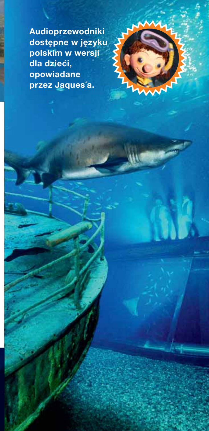
Nowo wyremontowane akwarium, o zawartości 2,6 mln. litrów wody