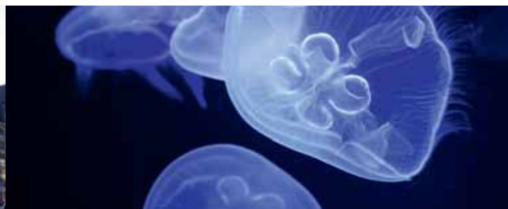
Meduza w akwarium: nie oślizgła, lecz fascynująca piękność