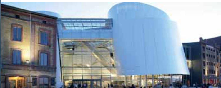
Modernistyczna architektura Oceanarium

Wskazówka: wsłuchajcie się Państwo w fascynujące dźwięki wielorybów