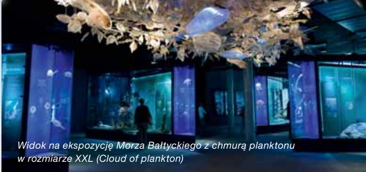
Widok na ekspozycję Morza Bałtyckiego z chmurą planktonu w rozmiarze XXL (Cloud of plankton)

Pokaz karmienia pingwinów o godzinie 12:00