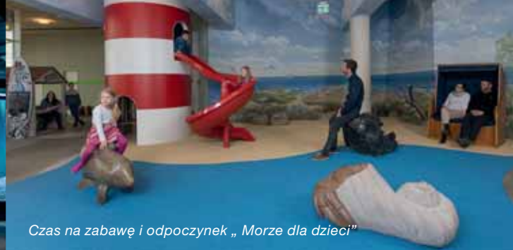
Czas na zabawę i odpoczynek „Morze dla dzieci”

Audioprzewodniki dostępne w języku polskim w wersji dla dzieci, opowiedane przez Jaques'a.