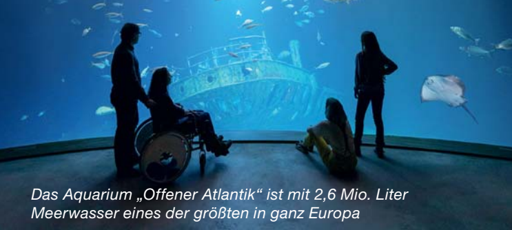
Das Aquarium „Offener Atlantik“ ist mit 2,6 Mio. Liter Meerwasser eines der größten in ganz Europa