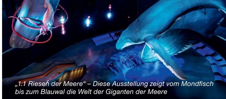
„1:1 Riesen der Meere“ – Diese Ausstellung zeigt vom Mondfisch bis zum Blauwal die Welt der Giganten der Meere