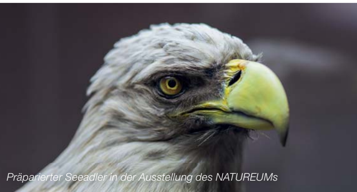
Präparierter Seeadler in der Ausstellung des NATUREUMs

Zugang in unmittelbarer Nähe vom NATUREUM