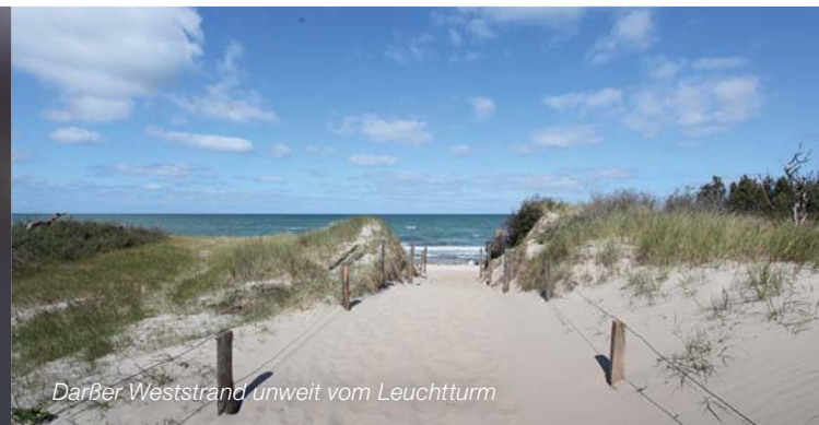
Darßer Weststrand unweit vom Leuchtturm