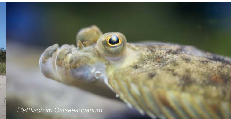
Plattfisch im Ostseeaquarium