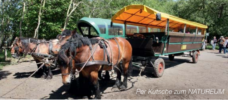
Per Kutsche zum NATUREUM