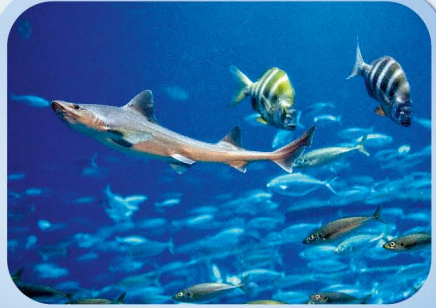
Nordseeaquarium „Weißgefleckter Glatthai“

Haihaut macht's möglich! Forscher entwickeln Oberflächen für Schiffe und Flugzeuge, die der Haihaut ähneln. Dadurch soll weniger Treibstoff verbraucht werden.