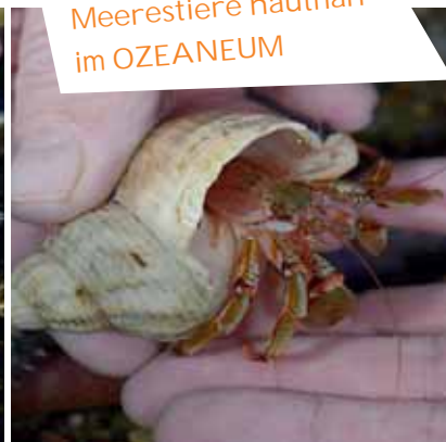
Meerestiere hautnah im OZEANEUM