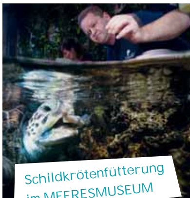
Schildkrötenfütterung im MEERESMUSEUM