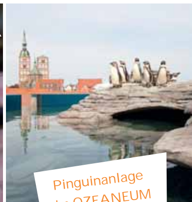
Pinguinanlage im OZEANEUM