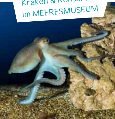
Kraken & Konsorten im MEERESMUSEUM