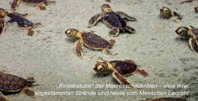
„Kinderstube“ der Meeresschildkröten – viele ihrer angestammten Strände sind heute vom Menschen bedroht