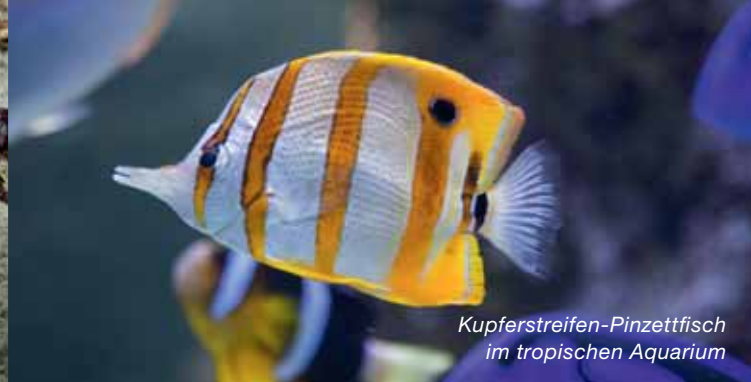
Kupferstreifen-Pinzettfisch im tropischen Aquarium