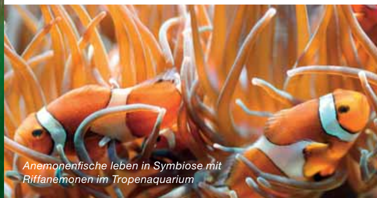
Anemonenfische leben in Symbiose mit Riffanemonen im Tropenaquarium

Entdecken Sie im 1. Obergeschoss originale Fischereitensilien, u. a. das Strandboot Erika, einen 2 000 Jahre alten Einbaum und Modellschiffe. Ein interaktives Fischratespiel lädt zum Mitmachen ein.