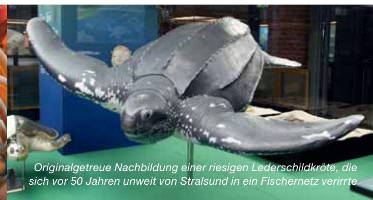
Originalgetreue Nachbildung einer riesigen Lederschildkröte, die sich vor 50 Jahren weit von Stralsund in ein Fischernetz verirrte

Tipp: Mo (Apr. – Okt.) + Mi + Fr um 13:00 Uhr Schildkrötenfütterung und Do um 11:00 Uhr Tauchgang – jeweils kommentiert