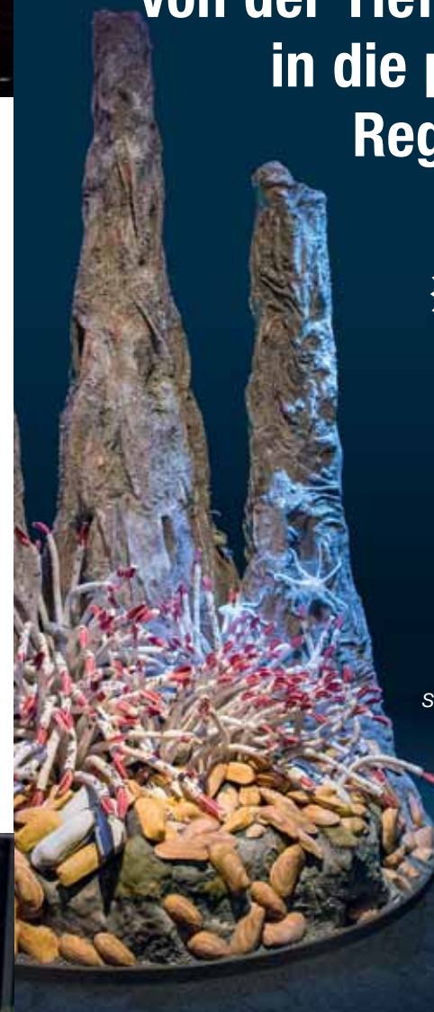
Das 3 Meter hohe Modell eines Schwarzen Rauchers zeigt das Leben an hydrothermalen Quellen in der Tiefsee.

Eine Initiative des Bundesministeriums für Bildung und Forschung Wissenschaftsjahr 2016*17 MEERE UND OZEANE