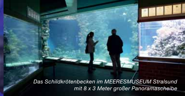
Das Schildkrötenbecken im MEERESMUSEUM Stralsund mit 8 x 3 Meter großer Panoramascheibe