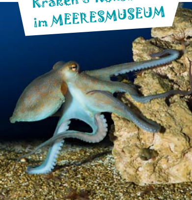
Kraken & Konsorten im MEERESMUSEUM