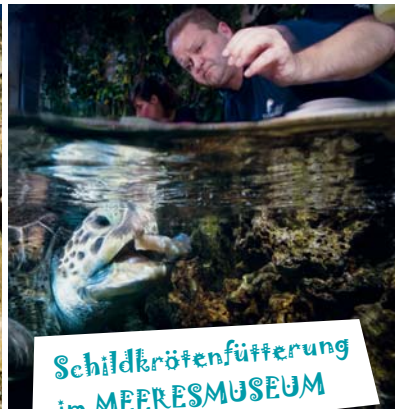
Schildkrötenfütterung im MEERESMUSEUM