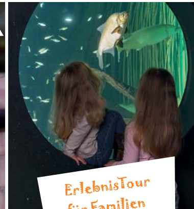
ErlebnisTour für Familien