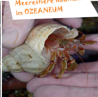
Meerestiere hautnah im OZEANEUM